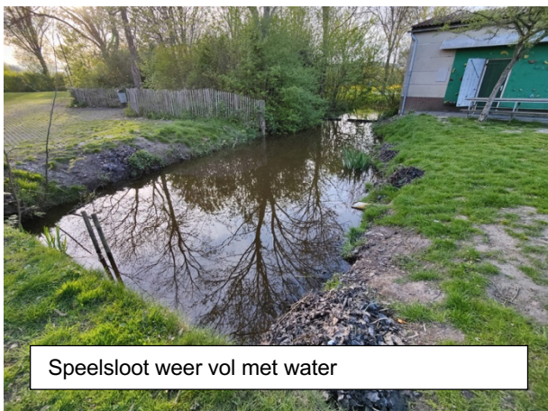
Speelsloot weer vol met water