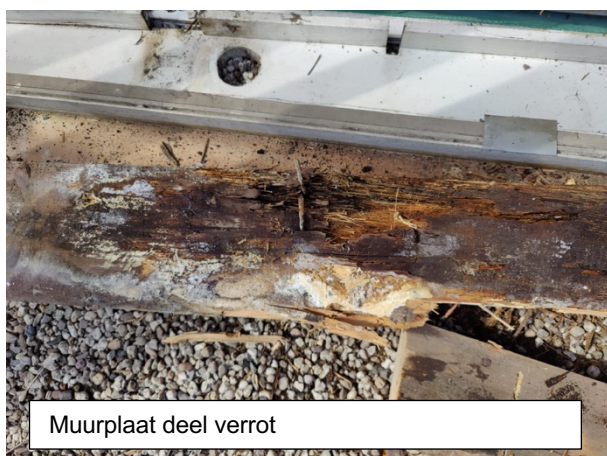
Muurplaat deel verrot