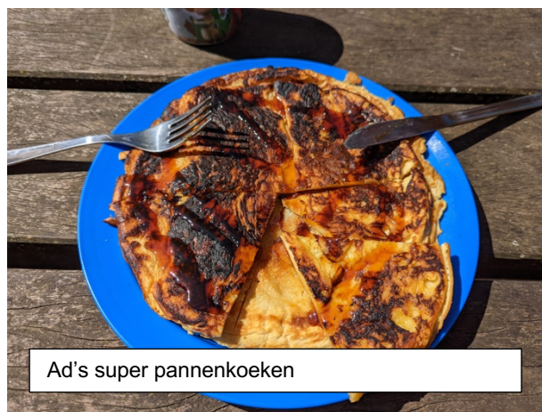
Ad's super pannenkoeken